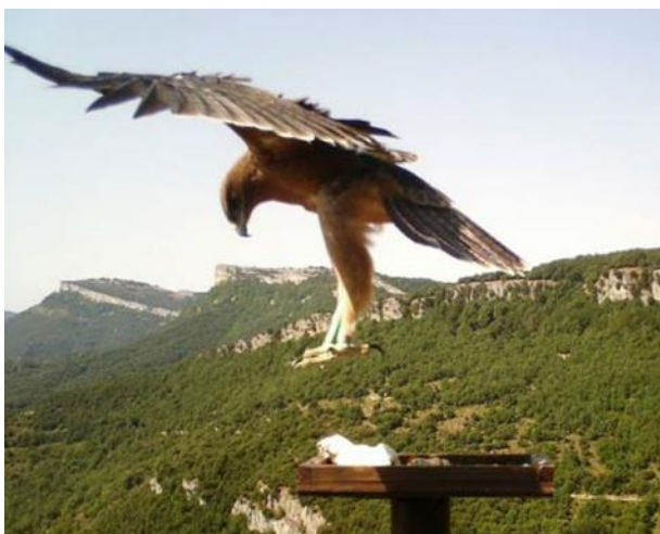
Korres sur l'aire d'alimentation en Alava – Piège-Photo