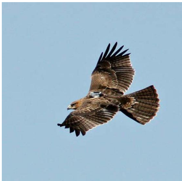
Korres en vol dans la région de Saragosse