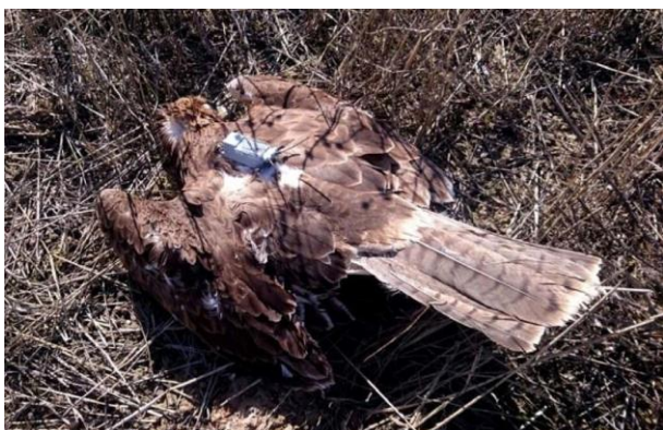
Cadavre de Korres au pied du poteau meurtrier