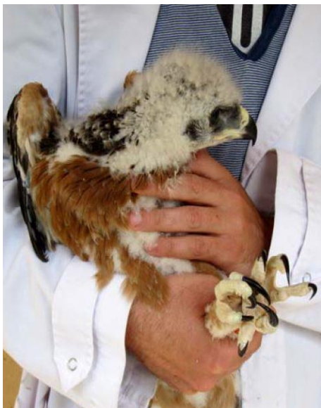
Korres poussin