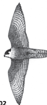
Bilan surveillance du faucon pèlerin - 2002

COORDINATION : JEAN-PIERRE MATERAC (LPO HAUTE-SAVOIE)