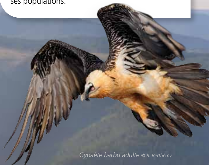
Gypaète barbu adulte

En plus des menaces naturelles (intempéries, prédation, avalanche ou insuffisance de ressources alimentaires), le gypaète doit faire face à des menaces liées à l'homme : tir au fusil, empoisonnement (plomb, pesticides...), collision contre les câbles de remontées mécaniques ou lignes électriques, dérangements pendant la période de reproduction, disparition de son habitat naturel, et bien sûr, le morcellement de ses populations.