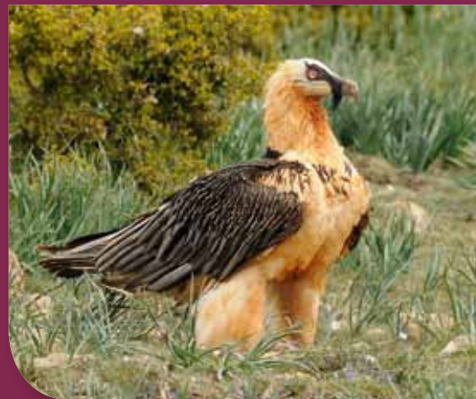
Gypaète barbu adulte

L'aventure semble bien partie avec Basalte et Cardabelle et ne demande qu'à se poursuivre !