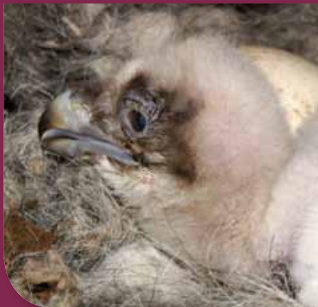
Cardabelle © M. Kaiser