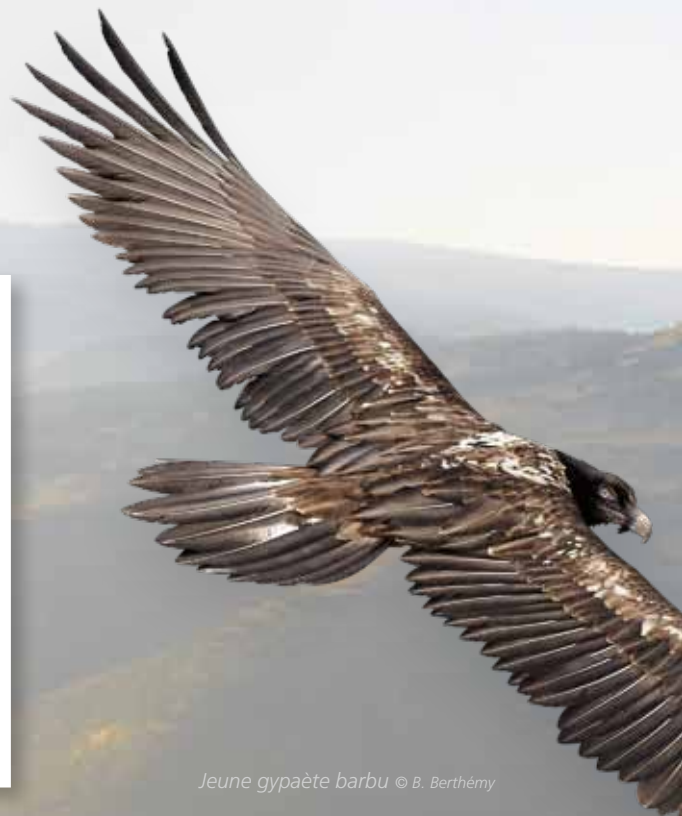
Jeune gypaète barbu

Le gypaète barbu est l'un des plus grands rapaces d'Europe : son envergure varie de 2,60 à 2,90 m, son poids de 5 à 7 kg. Avec sa tête emplumée, son cercle rouge autour de l'œil et sa barbichette sous le bec, il se colore volontairement en se baignant régulièrement dans de la boue riche en oxyde de fer, ce qui lui confère sa jolie teinte rouille orangé. Ces bains de boue servent à montrer aux autres gypaètes qu'il est maître en son territoire. Plus il est coloré, plus il est dominant. Son régime alimentaire constitué essentiellement d'os, qu'il sait casser pour les ingérer, lui vaut le surnom de casseur d'os. Comme les autres vautours, il exerce un service d'équarrissage et joue le rôle de « nettoyeur de la nature ».