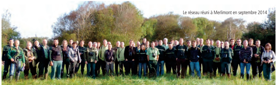
Le réseau réuni à Merlimont en septembre 2014