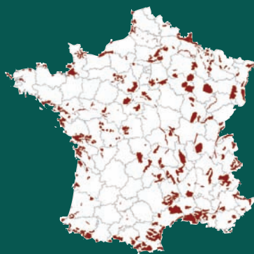
Carte ZICO en France

Les forêts françaises sont avec les zones humides les milieux qui accueillent la plus grande biodiversité au premier rang desquels les oiseaux. Pour preuve la centaine de sites forestiers désignés Zones de Protection Spéciale au titre de la directive Oiseaux gérée par l'Office national des forêts.