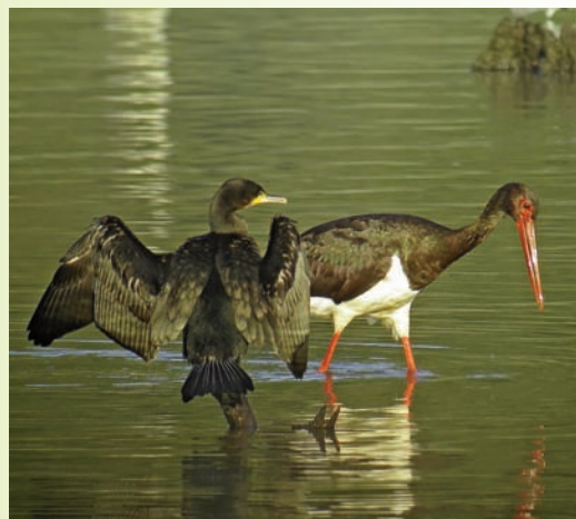
Cigogne noire et grand cormoran

Un programme cigogne noire Bourgogne Champagne-Ardenne est engagé sur trois ans avec le soutien financier des deux régions et les DREAL qui mobiliseront des financements d'Etat et de l'Europe. Trois grands axes sont déclinés : connaissance scientifique, communication, mesures de protection. L'ONF est porteur du projet en partena-