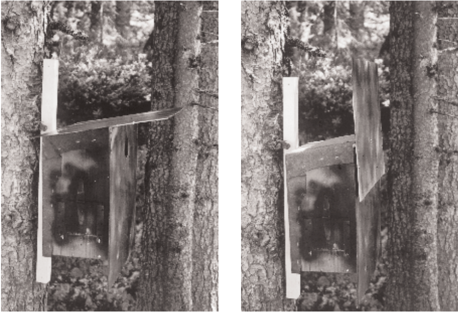
Prototype de nichoir à toit basculant avec le toit en position normale (à gauche) et avec le toit baissé, avant qu'il ne se remette en position (à droite). M. Beaud

rivets doivent se trouver sur la face et sous le toit, ceci permet le repositionnement automatique du toit et offre moins d'aspérités à la Martre.