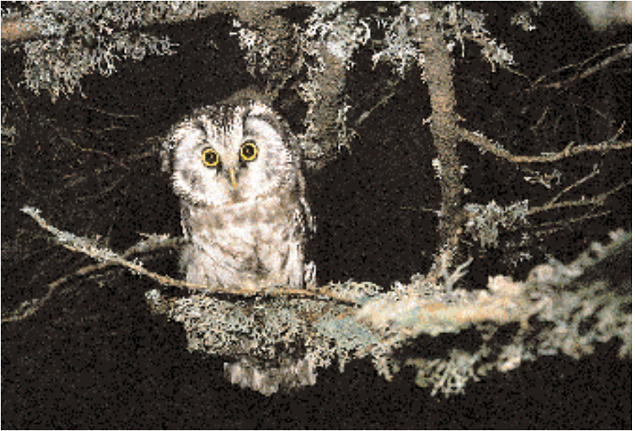
Chouette de Tengmalm adulte. La première preuve de nidification de cette chouette dans le canton de Fribourg date de 1986. La Berra, La Roche, 1981. M. Beaud