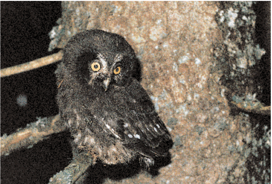
Jeune Chouette de Tengmalm proche de l'envol, lors d'un contrôle d'un nichoir à toit basculant. Charmey, 1993. M. Beaud