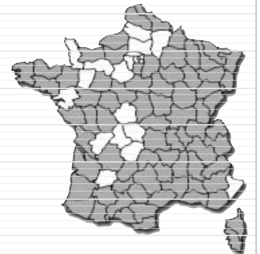
Départements dans lesquels des opérations de surveillance se sont déroulées en 2005